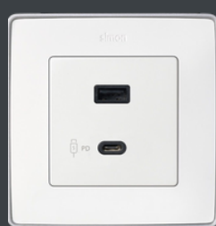
Simon 82 Detail