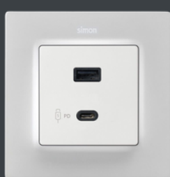
Simon 82 Concept